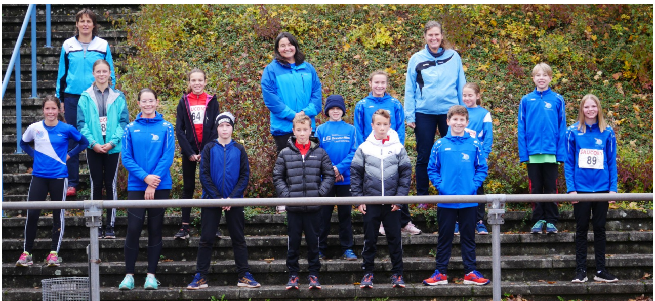
Bilder: Die Teilnehmer der LG bei der Talentiade in Vöhringen