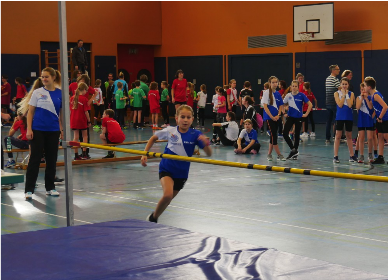
Bild: Impression vom Hallensportfest

Für die Stabhochsprunganlage der LG Donau-Ries, die derzeit am Rainer Sportplatz aufgebaut ist, wurde seitens der LG eine Abdeckung erworben und bereitgestellt, so dass die Anlage nun insbesondere vor Vandalismus und Wettereinflüssen geschützt ist und der aufwändige Auf- und Abbau (Einlagerung über die Wintermonate) im Frühjahr bzw. Herbst jetzt entfällt.