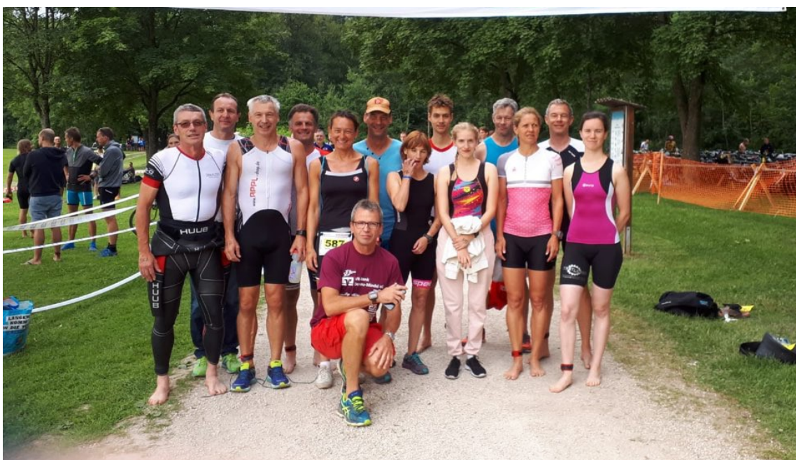
Bild: Oettinger Triathleten kurz vor dem Start des Wettkampfes in Lauingen

http://triathlon-oettingen.de/oettinger-triathlon/teilnehmer-info/